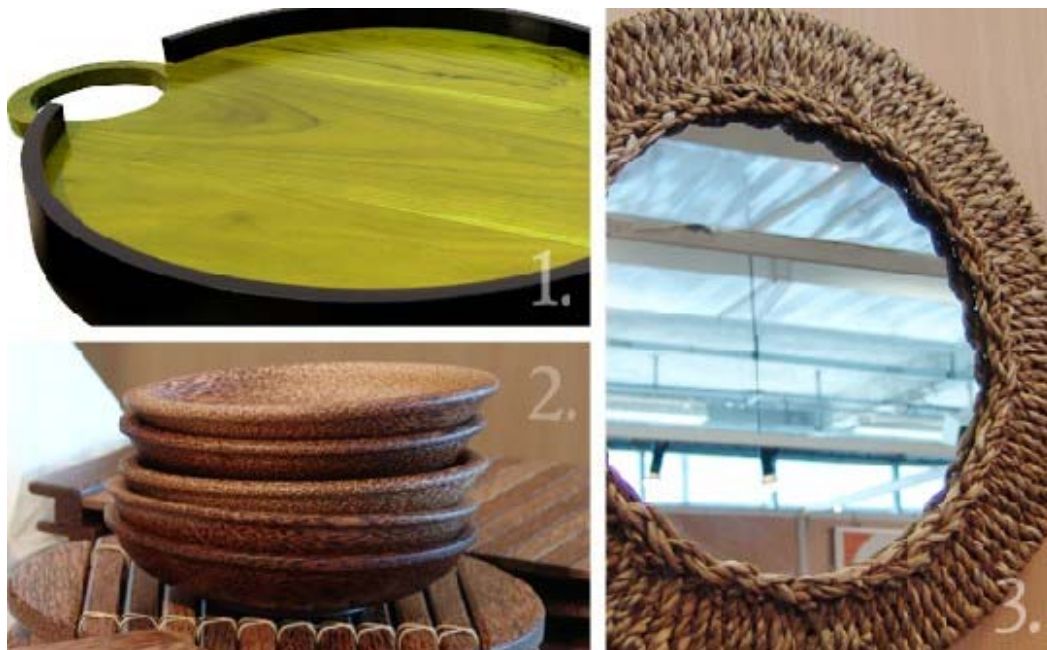
[1. Plateau Carmelina Rond , bois de Ghamar lasuré avec des teintes à base d'eau, Umae. [2. Coupes en bois massif , finition contact alimentaire sec, et dessous de plat rond, complété par du rotin (bois de Cocotier), Planet Coconut. [3. Miroir rond encadré d'un tressage d'algues, Up & Up.

A tord ou à raison, l'artisanat n'est pas porteur de modernité... qu'il soit d'ici ou d'ailleurs. Mais à parcourir les allées, force est de reconnaître qu'il n'est pas usurpé de parler de design équitable. Des lignes fortes, simples mais à l'esthétique efficace et actuelle. Le naturel y tient une bonne place, dans les teintes et les matériaux employés. Planet Coconut par exemple décline le cocotier de la noix au bois en passant par la palme, avec lesquels il compose des objets décoratifs qui allient bois de cocotier, marqueterie de coques de noix de coco, mais aussi un parquet dont les qualités rivalisent avec le chêne. "Vers 70 ans, le cocotier cesse de produire des fruits, ce n'est qu'à ce stade que l'arbre est exploité pour son bois" souligne Philippe Chetivet. Un jeune arbre est alors planté et ainsi se renouvelle le cycle de la vie et du design.